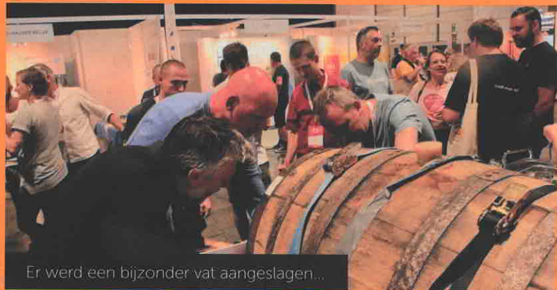
Er werd een bijzonder vat aangeslagen...

Beer Experience in Antwerpen verdient absoluut een tweede kans, met véél meer (Belgische) bezoekers.